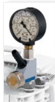
Vacuum regulation valve (mbar/torr) for non-corrosive gases

隔膜泵采用铝材质，是无油排气或抽取非腐蚀性蒸汽的正确之选。泵体由铝材质和特种塑料制成，可用作很多用途。高弹性的纤维增强的FPM双层膜片是膜片寿命长的关键所在。