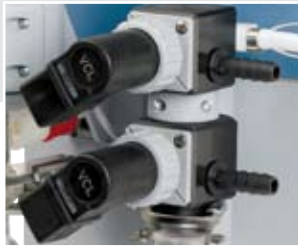
PC 520 NT 采用CVC 3000控制器