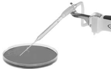
Fig. 3 - Poignée d'aspiration VHC

Le BioChem-VacuuCenter BVC 21 NT de VACUUBRAND est un système compact et convivial qui satisfait à toutes les exigences de sécurité et de fiabilité pour l'aspiration de liquide. Il répond dans tous les détails aux demandes du travail de laboratoire. Ses principaux composants sont : la pompe résistante aux produits chimiques, le flacon de récupération de 4 litres avec son filtre stérilisant 0.2µm et sa poignée ergonomique et adaptable. Le boîtier du BVC 21 NT est lisse pour faciliter la décontamination extérieure, et possède un emplacement pour la poignée. En sortie de pompe, un séparateur démontable récupère les éventuels liquides et joue le rôle de silencieux : un BVC fonctionne de manière à peine audible. Grâce à la puissance de la pompe, une seconde poignée d'aspiration peut être rajoutée sur le flacon (emplacement